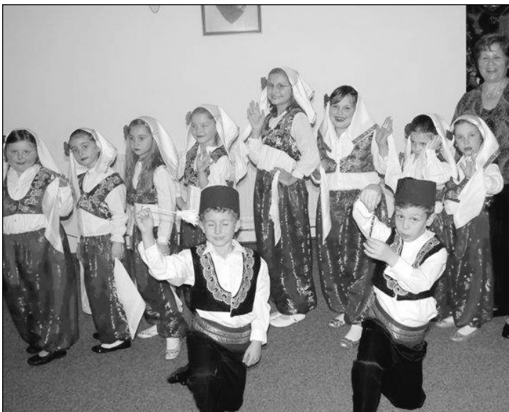
Folklor „Mladost Bosne“: Puni entuzijazma

- Za budućnost folkloru u Birminghamu ne treba se brinuti. Generacije se smjenjuju, jedni odlaze iz folkloru, a dolaze mladi, koji jedva čekaju da zaigraju. Od oktobra smo startali s novom sezonom. Tokom prošle godine izvršena je potpuna smjena