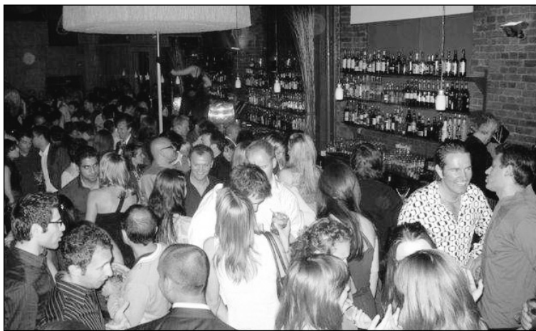
S jednog od okupljanja: Više od dvije stotine članova