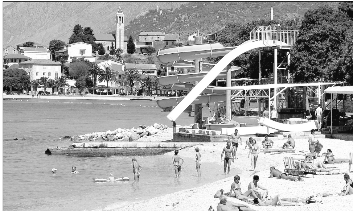
Gradac: Poluprazne plaže

U Gracu i Zaostrogu očekuju uspješnu sezonu samo ako im dođu turisti iz BiH • Ovo je najneizvjesnija godina, kažu u jednoj od turističkih agencija