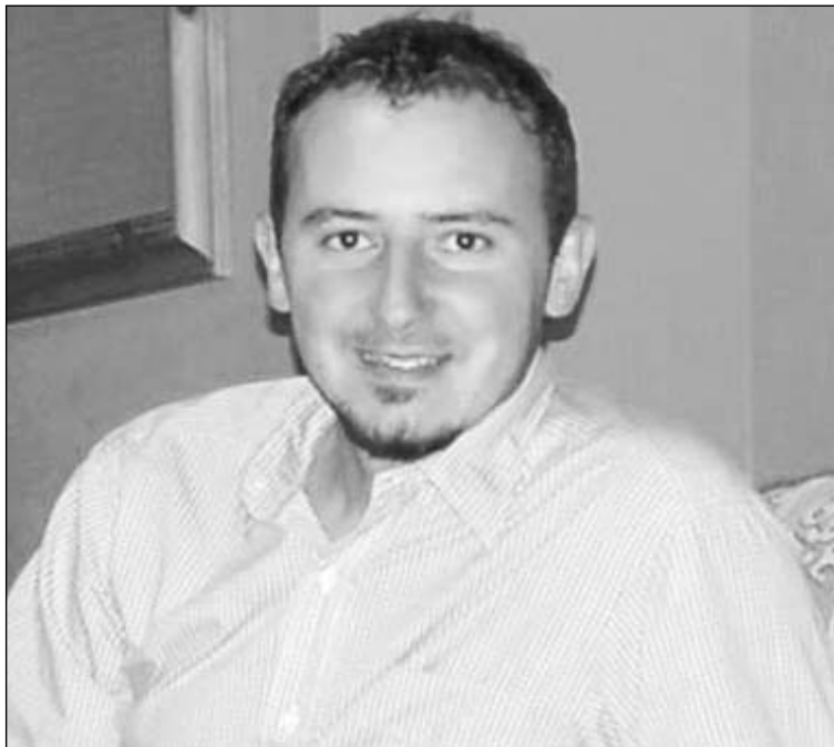
Burazerović: Mršavi rezultati